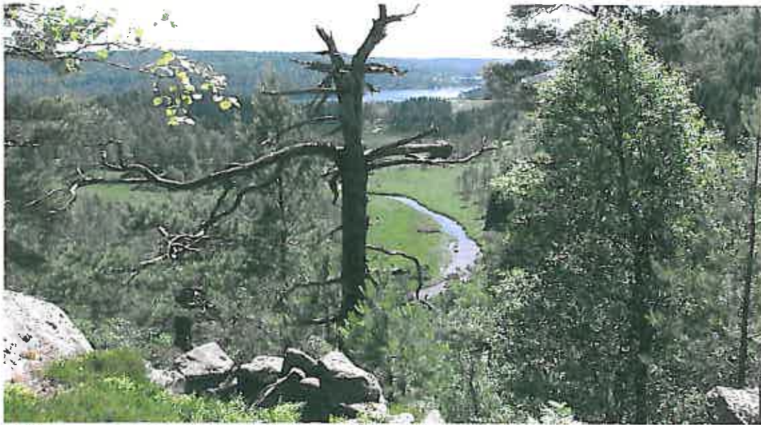
Bildet viser utsikten fra bygdeborja på Abestad.

Audnedal kommune er en naturskjønn kommune med nydelig vann, fine strender, flott kulturlandskap og store heieområder.