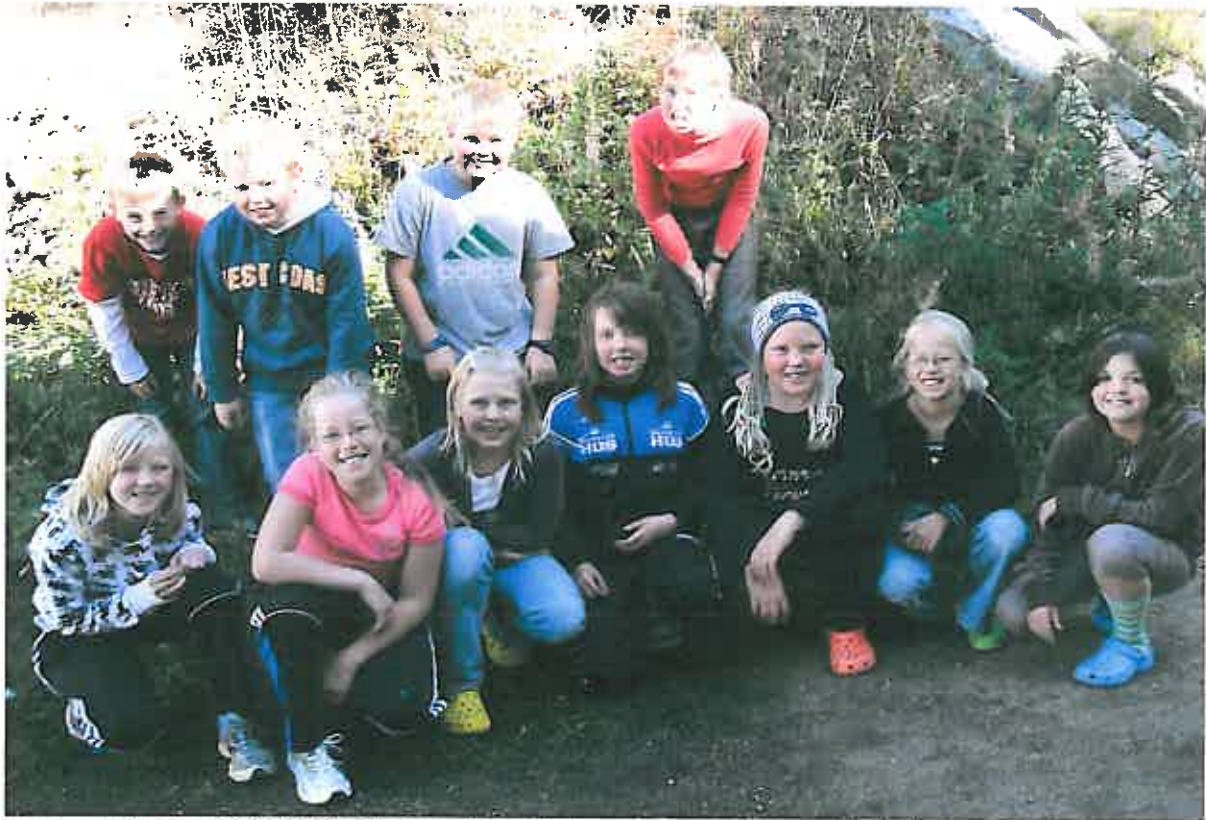
Her er 7.klasse 2008/2009 fra Byremo barneskole på tur – de vet hvor de skal!