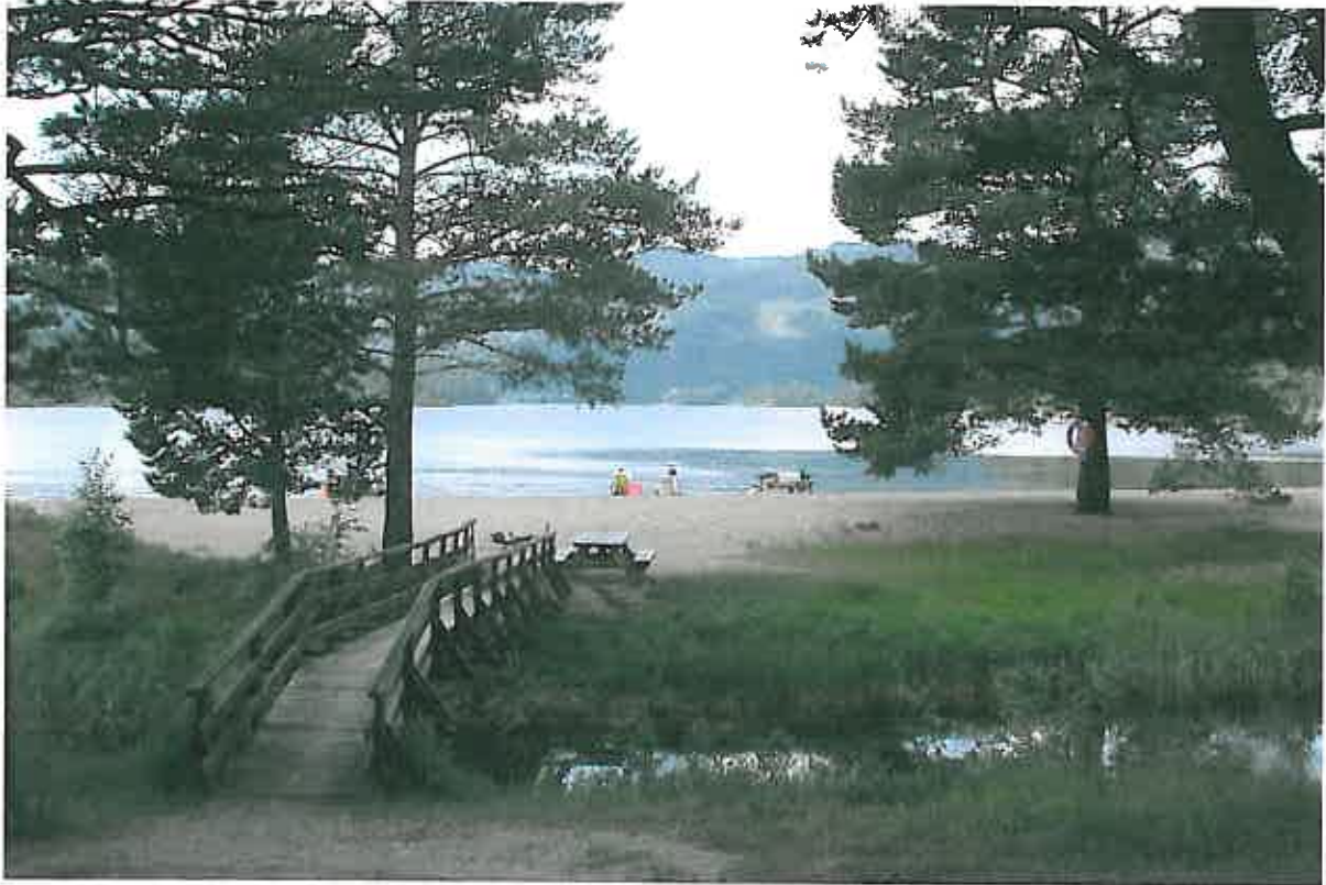
Et glimt fra Byremosanden!

Audnedal kommune har et utrolig godt naturmessig utgangspunkt for at innbyggerne skal trives i kommunen, og for at andre skal synes at mulighetene for natur- og friluftsliv er så flotte her at de kan tenke seg å flytte til!